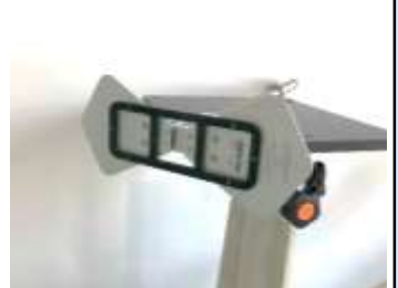
無線機近接照射試験 (ISO11452-9)