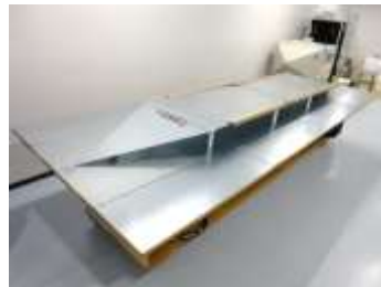
ストリップライン試験 (ISO11452-5)